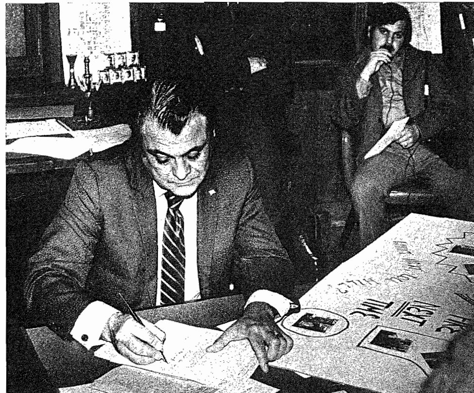
Hij weet dat hem een picket line voor zijn kantoor boven het hoofd hangt (en nog veel meer) als hij halsstarrig blijft.