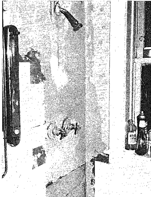
Techniek: maak van de mankementen van het huis foto's, als je met de huiseigenaar gaat praten. Je hoeft dan niet te kletsen, maar hebt bewijzen in de hand.